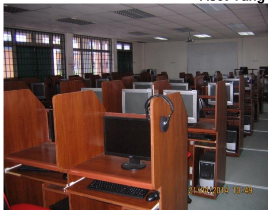
Lokasi: Makmal Bahasa Tarikh: 21 April 2014