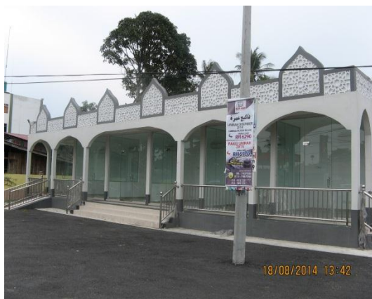
Gambar 2.6 Kios Mesin ATM

Lokasi: Simpang Empat Ketereh Tarikh: 18 Ogos 2014