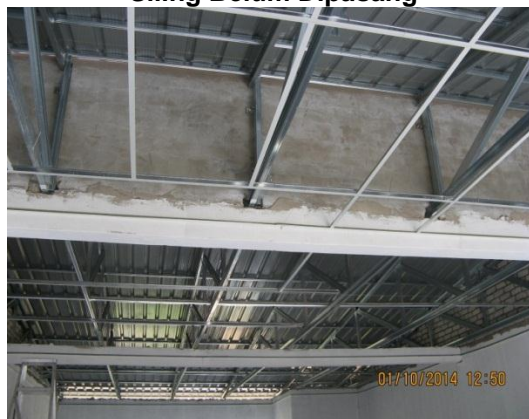
Gambar 2.2 Siling Belum Dipasang

Sumber: Jabatan Audit Negara Lokasi: Bandar Chiku 3 Tarikh: 1 Oktober 2014