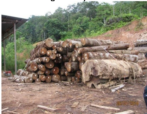
Gambar 1.7 Sebahagian Daripada 322 Tual Kayu Balak Yang Dipindah Secara Haram

Lokasi: Kilang Kayu Sri Mahligai Rubber Wood, Kemubu, Kuala Krai Tarikh: 26 Ogos 2014