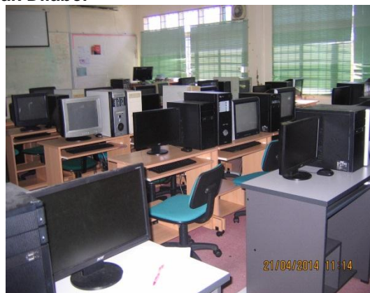
Lokasi: Makmal Komputer Tarikh: 21 April 2014