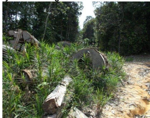
Lokasi: HSK Sungai Rek, Kuala Krai Tarikh: 4 Ogos 2014

1.4.7.3. Bagi kes kedua ia mula dikesan pada 3 Januari 2014 berdasarkan aduan awam. Mengikut siasatan Renjer Hutan Jajahan Kuala Krai, lokasi aduan ialah di dalam Kompartmen 39 dan 40 HSK Sungai Durian. Didapati tebang haram melibatkan 186 tunggul dari pelbagai spesis pokok kayu balak bermutu tinggi dalam kawasan dianggarkan seluas 20 hektar. Pokok-pokok yang ditebang dibiarkan sahaja tanpa dipotong untuk dijadikan tual balak. Nilai semasa kayu balak yang disita dianggarkan RM366,270. Semakan Audit mendapati kertas siasatan bagi kes ini belum selesai dan masih belum dibawa ke JKPP untuk membuat keputusan pelupusan. Tinjauan Audit bersama pihak PHJ dan RHJ Kuala Krai pada 21 Julai 2014 mendapati kayu balak tersebut telah dilonggok di matau berhampiran seperti di Gambar 1.5 dan Gambar 1.6 .