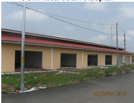
Gambar 2.1 6 Unit Kedai Belum Disiapkan

Lokasi: Bandar Chiku 3 Tarikh: 1 Oktober 2014