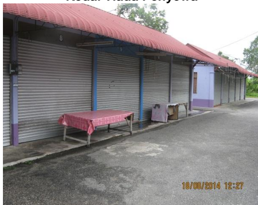
Gambar 2.3 Kedai Tiada Penyewa

Lokasi: Dataran Usahawan Kok Lanas Tarikh: 18 Ogos 2014