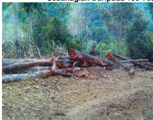
Gambar 1.1 Sebahagian Daripada 105 Tual Kayu Balak Yang Masih Terbiar

Lokasi: HSK Sungai Rek, Kuala Krai Tarikh: Mei 2013