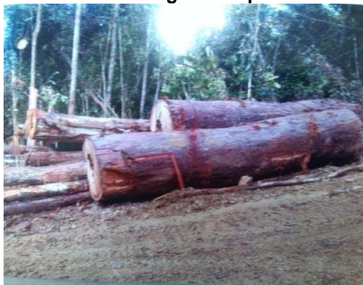
Lokasi: HSK Sungai Rek, Kuala Krai Tarikh: Mei 2013