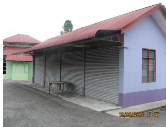
Gambar 2.4 Kedai Tiada Penyewa

Lokasi: Dataran Usahawan Kok Lanas Tarikh: 18 Ogos 2014