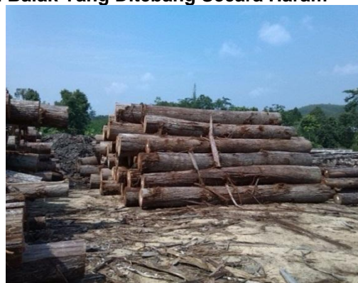
Lokasi: HSK Sungai Durian, Kuala Krai Tarikh: 21 Julai 2014

1.4.7.4. Bagi kes ketiga, dikesan pada 5 Ogos 2014 berdasarkan aduan awam mengenai kemasukan kayu balak secara haram ke kilang kayu Sri Mahligai Rubber Wood, Kemubu, Kuala Krai. Berdasarkan laporan Renjer Hutan Kuala Balah, terdapat 322 tual kayu balak bulat pelbagai jenis dan saiz berada di premis kilang tanpa pas pemindah dan tanda tukul hasil. Nilai rampasan semasa dianggarkan sejumlah RM118,050. Kayu balak tersebut disita dan laporan polis dibuat pada 6 Ogos 2014. Tinjauan Audit bersama