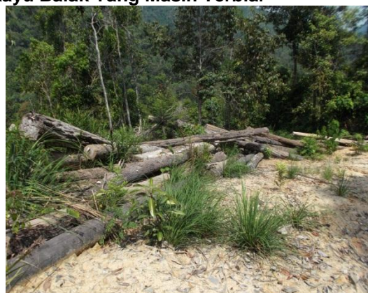
Gambar 1.2 Masih Terbiar

Lokasi: HSK Sungai Rek, Kuala Krai Tarikh: 4 Ogos 2014