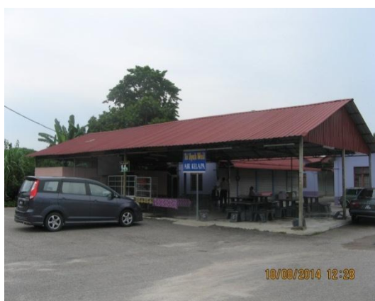
Gambar 2.5 Kedai Makan Tiada Penyewa

Lokasi: Dataran Usahawan Kok Lanas Tarikh: 18 Ogos 2014