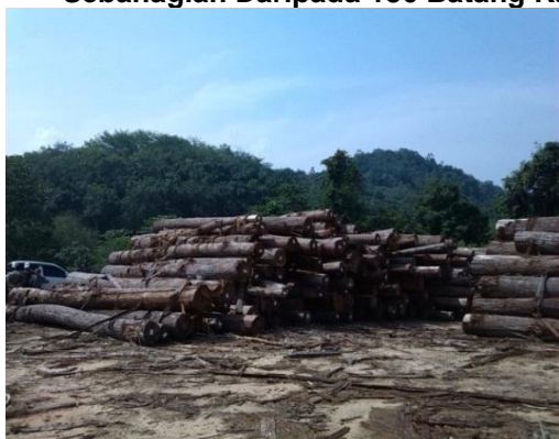
Lokasi: HSK Sungai Durian, Kuala Krai Tarikh: 21 Julai 2014